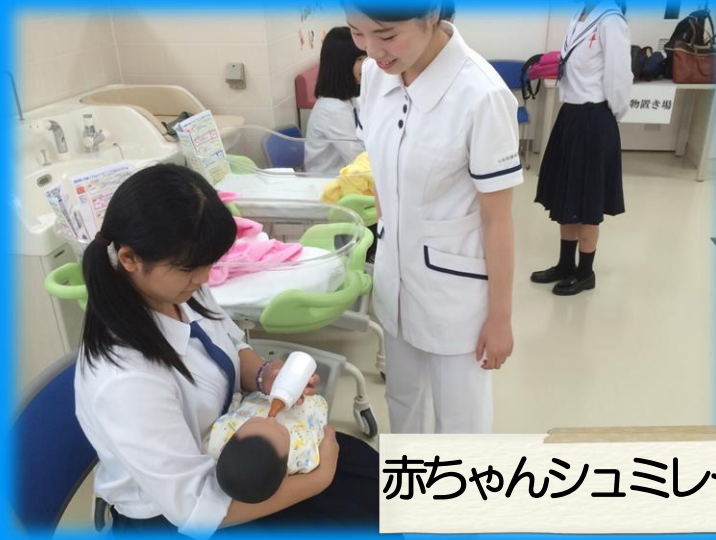
赤ちゃんシュミレーター体験