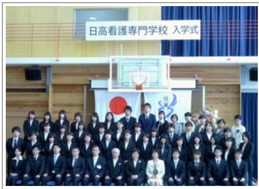
第2期生全員で記念撮影→

←第2期生を代表して、新たな気持ちを宣誓します。報道の方も真剣な表情をねらいます